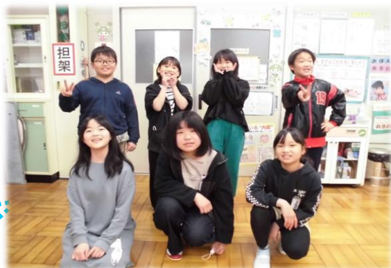
このような活動を行います!