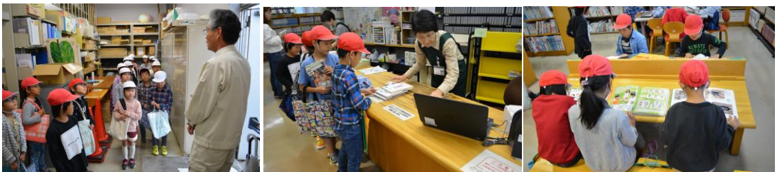
【11月6日 図書館見学の様子】

来週の木曜日、本校は145歳の誕生日を迎えます。川本南小学校ができてから145年。145年前というと、西暦1873年です。時代は明治にまでさかのぼります。そう考えると、歴史のある学校なんだと改めて感じます。毎日毎日、子どもたちを145年間見守り続けてきた川本南小学校。心から感謝したいと思います。(学校は通常通りです。)