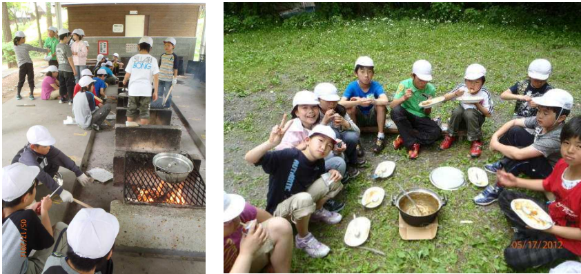
〈2日目のカレー作り〉