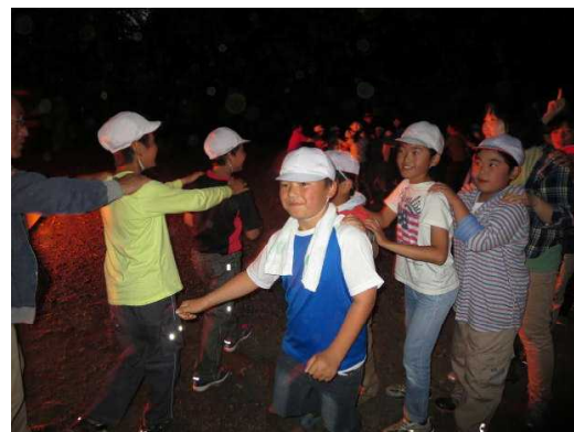
キャンプファイヤー